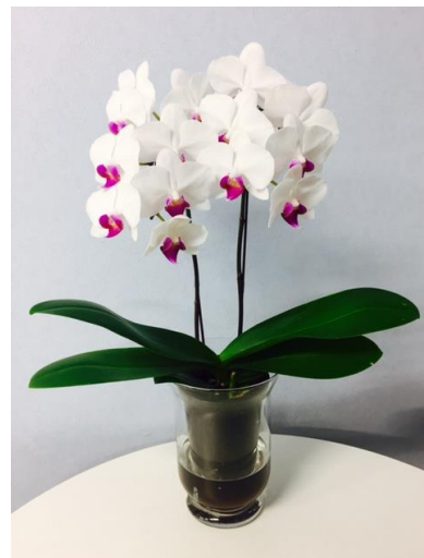
★タンブラーグラス 4.5号 2本立ち