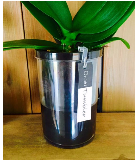
★タンブラーポット 4号 2本立ち