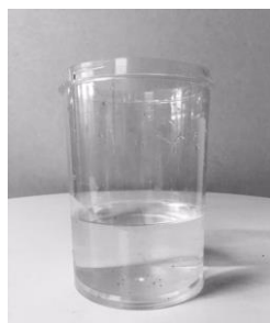
② 下から1/3程度、 水を入れます。