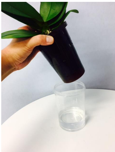
① 内容を回して外します。